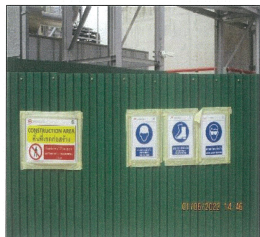
รูปที่ 12 ป้ายเตือนในบริเวณพื้นที่รื้อถอน/ก่อสร้าง