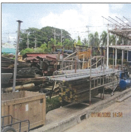
รูปที่ 11 พื้นที่กองเศษวัสดุต่าง ๆ