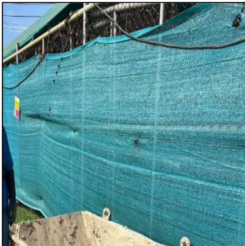
รูปที่ 3 แผงตาข่ายกันฝุ่นละออง