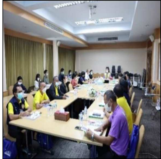
รูปที่ 14 การประชุมของคณะกรรมการตรวจสอบ ผลกระทบสิ่งแวดล้อมของโครงการ เมื่อวันที่ 21 ธ.ค. 65