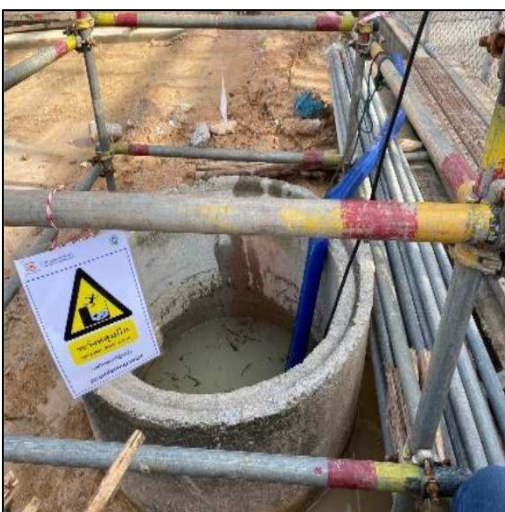
รูปที่ 5 บ่อดักตะกอน