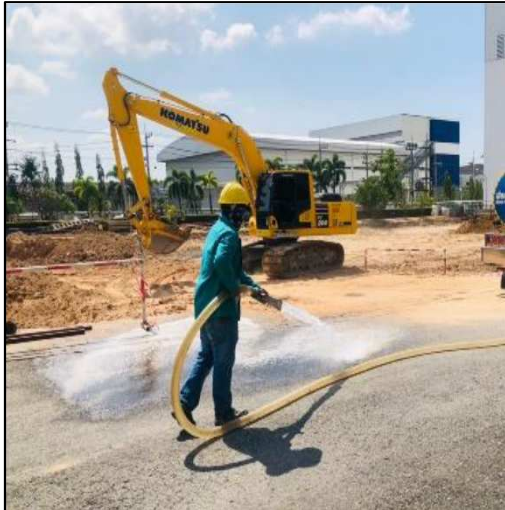
รูปที่ 1 การฉีดพรมน้ำบริเวณพื้นที่รื้อถอน/ก่อสร้าง