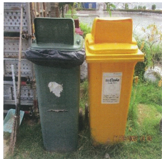
รูปที่ 10 ถังขยะภายในพื้นที่รื้อถอน/ก่อสร้าง