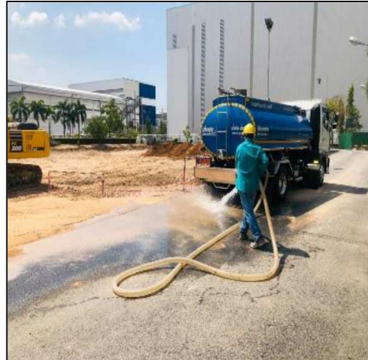
รูปที่ 2 การทำความสะอาดล้อรถบรรทุก