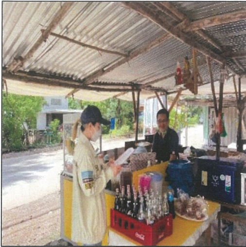
รูปที่ 7 เจ้าหน้าที่โครงการลงพื้นที่สอบถามชุมชน