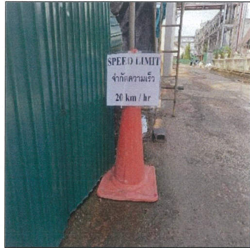
รูปที่ 8 ป้ายจำกัดความเร็วในพื้นที่รื้อถอน/ก่อสร้าง