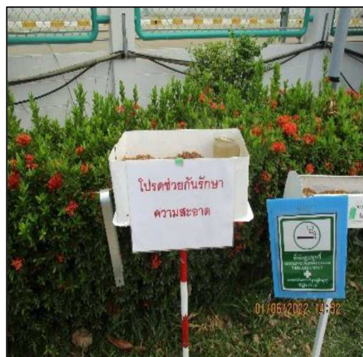
รูปที่ 6 ป้ายรณรงค์ให้รักษาความสะอาดในพื้นที่โครงการ