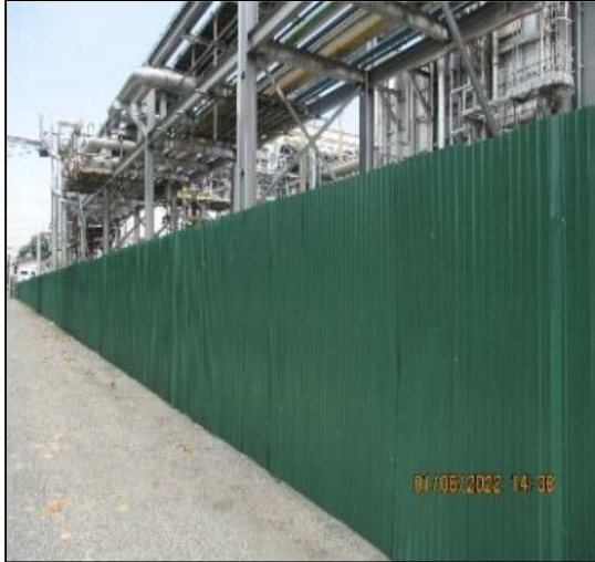
รูปที่ 13 ร้วกั้นบริเวณพื้นที่รื้อถอน/ก่อสร้าง